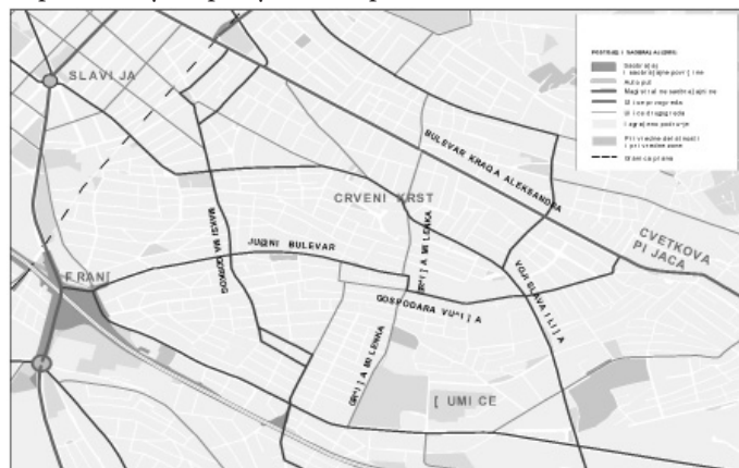
Слика 1 – Извод из Генералног плана Београда 2021. – Постојећи саобраћај

Траса Јужног булевара полази од раскрснице Нова аутокоманда на којој се, што у нивоу што денивелисано, укрштају следеће саобраћајнице: Аутопут, Булевар ослобођења (градска магистрала), Устаничка улица (улица првог реда), Небојшина (улица другог реда) и Бокелска улица (део секундарне уличне мреже). Јужни булевар завршава испод стадиона Фудбалског клуба „Обилић” као слепа улица. На свом правцу укршта се са улицама примарне и секундарне уличне мреже. Улица Господара Вучића почиње од Устаничке улице као „слепа” улица, тј. без могућности изласка на исту. На свом правцу укрштасе са улицама примарне и секундарне уличне мреже.