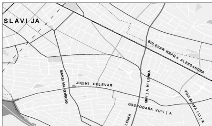
Слика 2 – Извод из Генералног плана Београда 2021. – Планирани саобраћај

до Јужног булеvara, добија секундарни значај. Планирано је продужење Бојанске улице од Сазонове, преко Церске и Шуматовачке до Јужног булеvara, стварајући при томе четворокраку раскрсницу са Улицом Владимира Карића. На тај начин ће бити омогућена директна веза са саобраћајним правцем Цара Николаја II – Жичка и са Булеваром краља Александра. Остале улице у оквиру границе плана, у функционалном смислу, и даље ће имати секундарни значај.