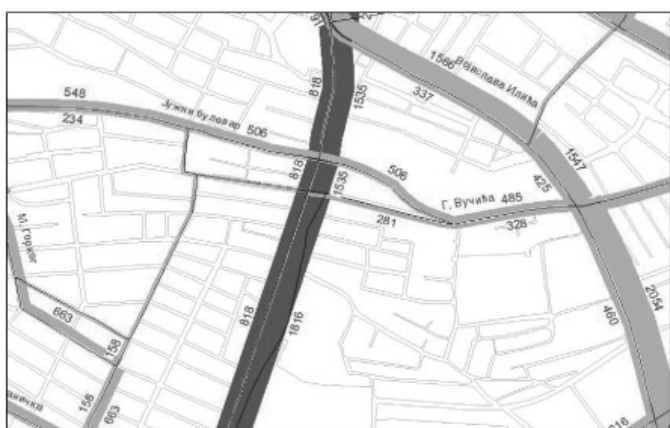
Слика 3 – Оптерећење предметне деонице у уличној мрежи предложеној у Генералном плану Београда 2021. када егзистира и УМП

Изградњом једног оваквог алтернативног правца, саобраћајно оптерећење на предметној деоници Улице Господара Вучића, неће се битно променити у односу на постојеће стање. То се може видети на слици оптерећења предметне деонице у уличној мрежи предложеној у Генералном плану Београда 2021. („Службени лист града Београда”, бр. 27/03, 25/05, 34/07 и 63/09) када егзистира и УМП.