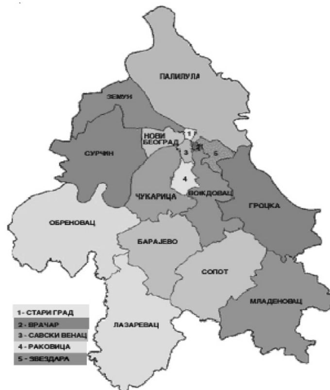
Графички приказ градских општина на територији града Београда

Са преко 140 насеља, од којих нека имају значај европске метрополе (Београд), неке субрегионалног центра у Србији (Обреновац, Лазаревац, Младеновац), неколико мањих урбаних центара, па све до великог броја сеоских и полуурбаних