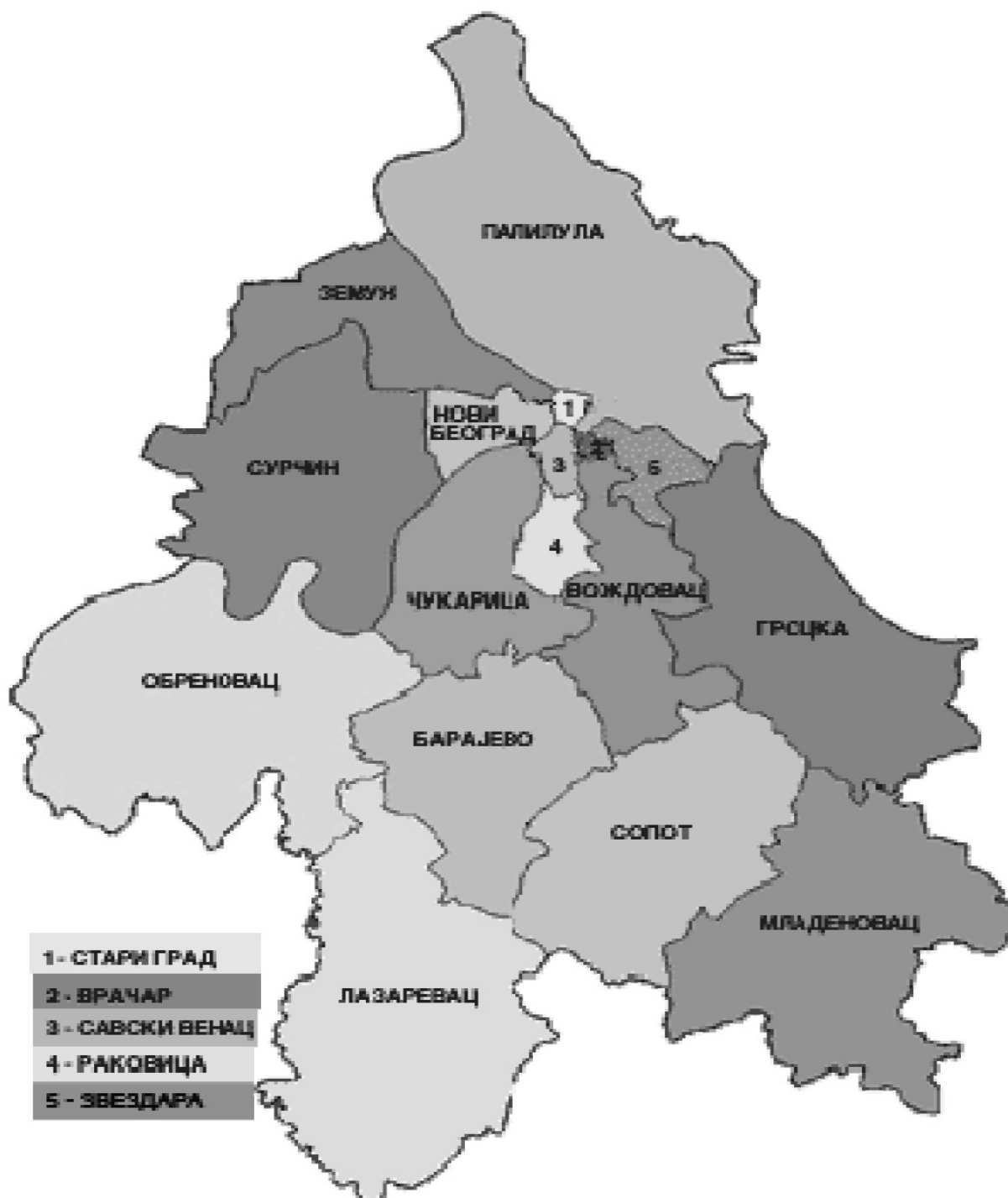
Графички приказ градских општина на територији града Београда

Градске општине Града Београда су: Барајево, Вождовац, Врачар, Гроцка, Звездара, Земун, Лазаревац, Младеновац, Нови Београд, Обреновац, Палилула, Раковица, Савски венац, Сопот, Стари град, Сурчин и Чукарица.