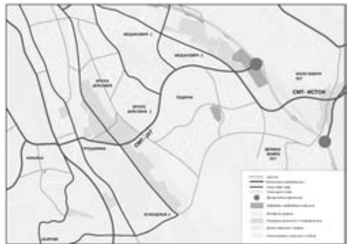
Слика 1: Планирана улична мрежа (извод из ГП-а Београда 2021)

Управо један од таквих потеза је јужна деоница СМТ-е која повезује Ибарску магистралу са градским аутопутем у чвору „Ласта”. Деонице планиране за реконструкцију / изградњу на овој траси су: део нове улице Патријарха Димитрија у Раковици од Улице ослобођења до Пере Велимировића, деоница коју чине правци Црнотравска, Саве Машковића, Кружни пут, Браће Јерковић и веза овог потеза са градским аутопутем у петљи „Ласта” и источном деоницом СМТ.