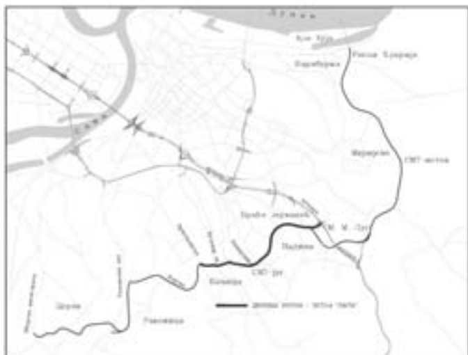
Слика 2: Положај трасе СМТ-југ и СМТ-исток у односу на шире подручје града