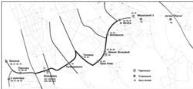
Слика 14: Стајалишта и терминали на траси СМТ (постојеће стање)

На свим примарним саобраћајним правцима које пресеца предметни потез остварују се везе са радијалним линијама јавног градског превоза. На позицији укрштаја трасе СМТ са улицом Војводе Степе пресеца се трамвајска пруга којом саобраћају три трамвајске линије које насеље Бањицу, улицом Војводе Степе и преко најужег централног подручја, повезују са другим градским просторима.