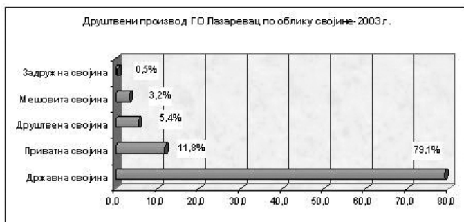
Графикон: Приказ ДП ГО Лазаревац по облику својине